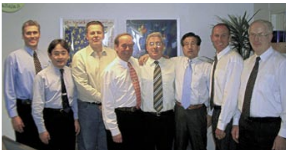
Groupe de travail du comité Technique de WorldSkills a visité Helsinki au début d'octobre.